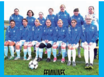
Football ESN P. 08

Journal d'informations municipales de Normanville - Décembre 2017 - N° 24