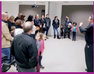
Nouveaux arrivants P. 01