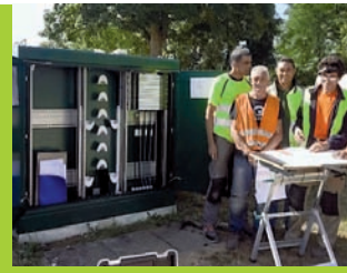
Fibre optique P. 03