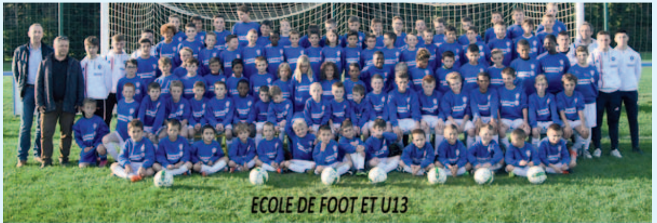
ECOLE DE FOOT ET U13

Avec près de 80 enfants, les effectifs sont satisfaisants sauf en U7 comme exprimé en introduction, où nous souhaiterions plus d'enfants mais aussi plus de jeunes filles pour féminiser nos