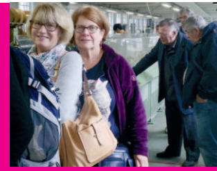
Club Bien-Etre Et Amitié P. 07