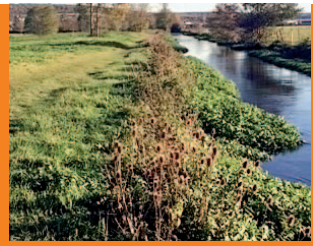
Travaux communaux P. 02