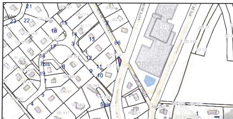
Descriptif détaillé de la parcelle : 27439 D 338 Commune : NORMANVILLE