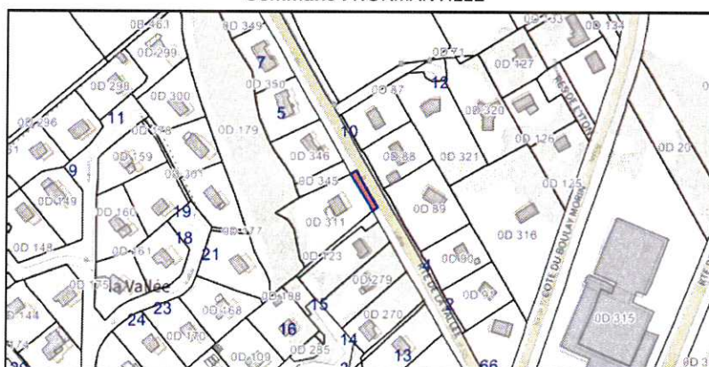
Descriptif détaillé de la parcelle : 27439 D 312 Commune : NORMANVILLE